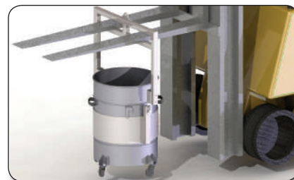
Kit levage conteneur