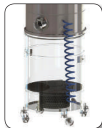
Kit grille et équilibre pour récupération produit aspiré en sac plastique