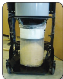
Kit LONGOPAC pour récupération produit aspiré en sac plastique