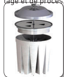
Kit filtre absolu H14